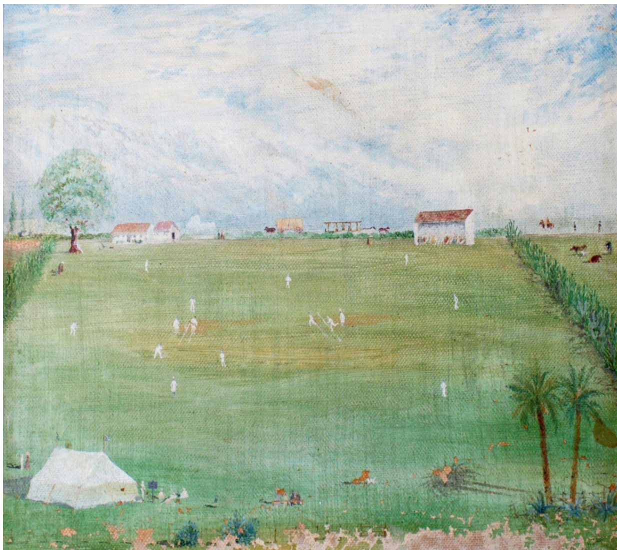
Figura 2. Óleo del Montevideo Cricket Club 1870-1880.

La perspectiva es la de un observador ubicado al centro del campo sobre lo que hoy es la Avenida Centenario, en el momento de una práctica o partido de cricket.