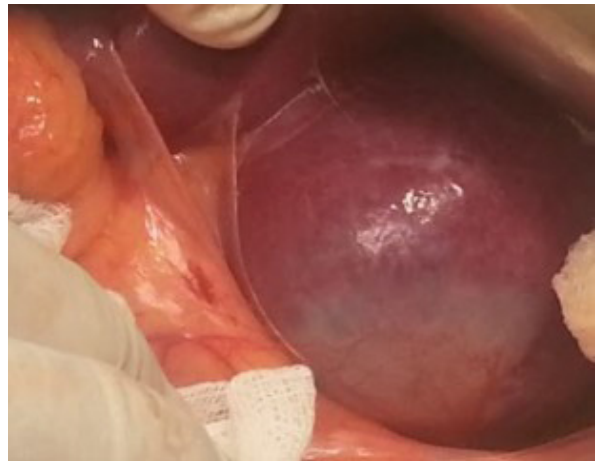
Figura 2. Vista intraoperatoria de la lesión esplénica que sustituye el polo inferior del Bazo.