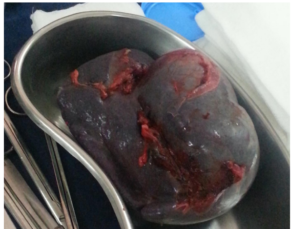
Figura 3. Pieza