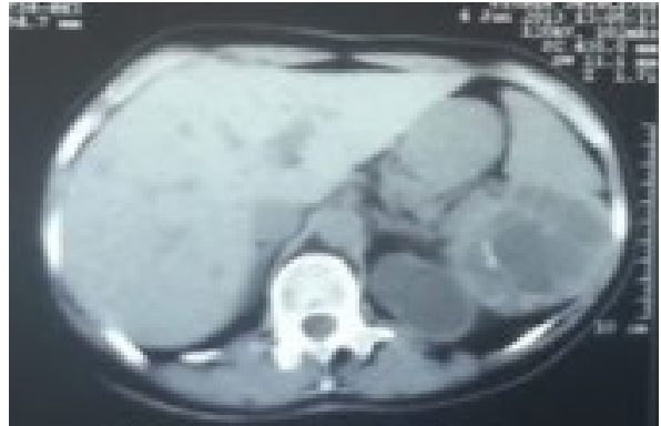
Figura 1. Se visualiza imagen quística única multivesicular multiseptada, con calcificaciones, compatible con quiste hidatídico esplénico.

La anatomía patológica confirma la presencia de un quiste hidatídico esplénico completo. En cuanto al seguimiento no presentó recurrencia de la enfermedad ni complicaciones alejadas durante el año siguiente a la cirugía otorgándose el alta definitiva.