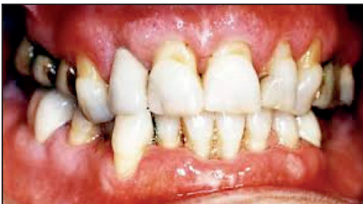
Paciente diabético en el que se presenta enfermedad periodontal avanzada.

Es decir que, el hecho de ser diabético implica que el paciente tenga un riesgo aumentado de contraer esta enfermedad, por lo que se hace necesario extremar los cuidados de higiene bucal, así como aumentar la periodicidad de los controles ya que es la placa microbiana (placa que se adhiere a los dientes formada por bacterias y restos de comida) la causante de esta enfermedad.