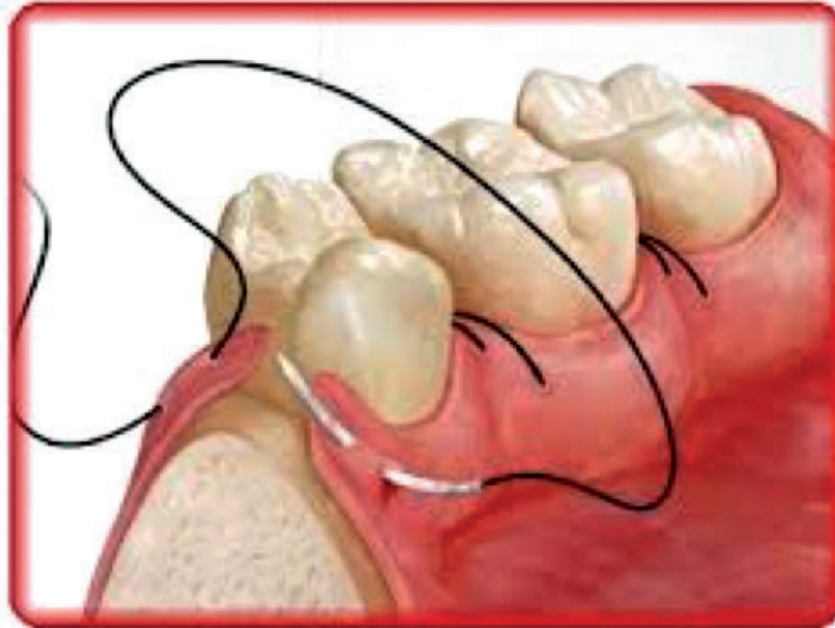
Puntos luego de una extracción dentaria.

Como ejemplo, y como procedimientos que se realizan con más frecuencia, conviene que al realizarle al paciente una extracción dentaria esta sea terminada con la aplicación de sutura (puntos) de forma tal de acercar más los "bordes" de la herida y favorecer el cierre de la misma.